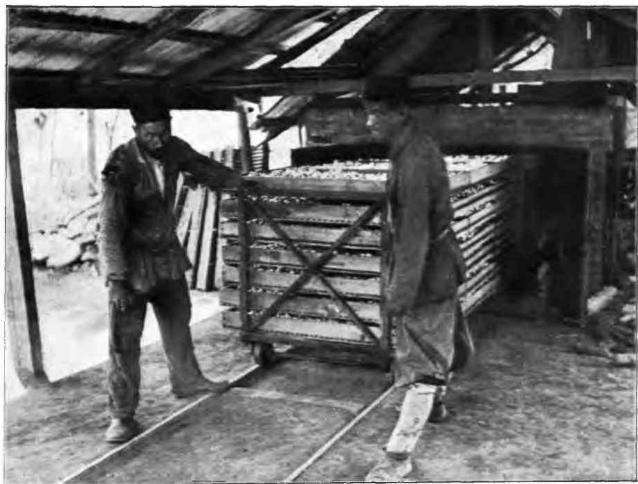
Рис. 118. Морильня скупщика коконовъ въ Кутаисской губ.