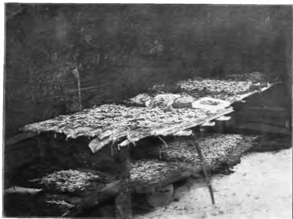
Рис. 116. Туземный способ выкормки червей в Бакинской губ.