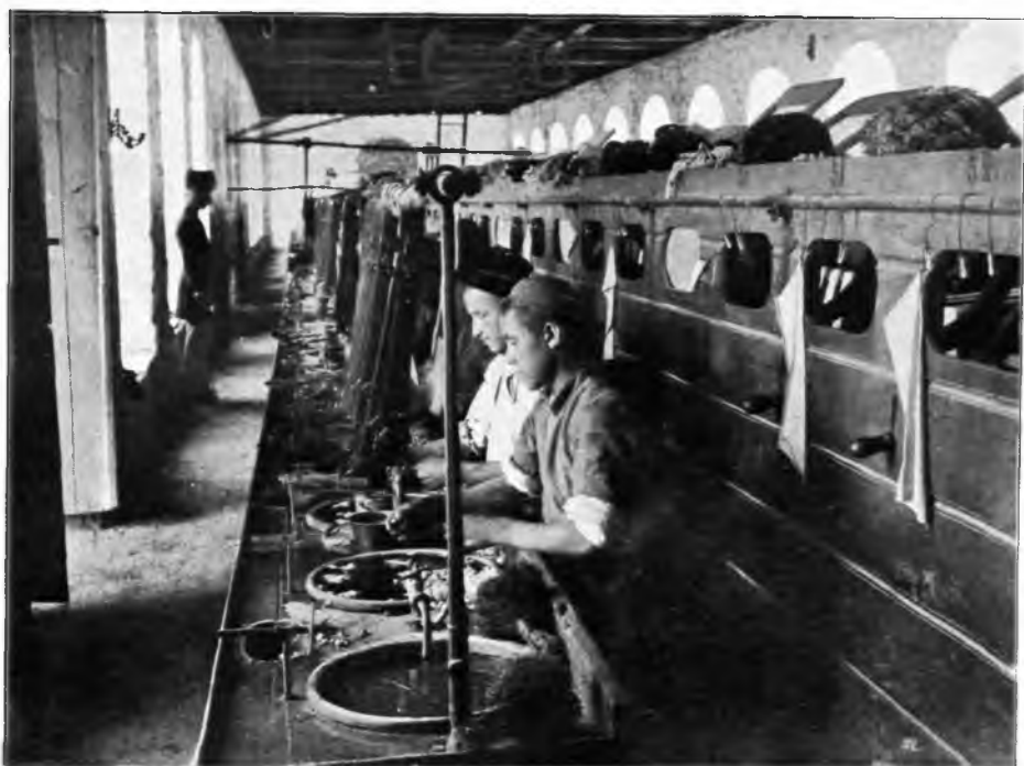
Рис. 121. Шелкомотальный заводъ въ г. Нухъ.