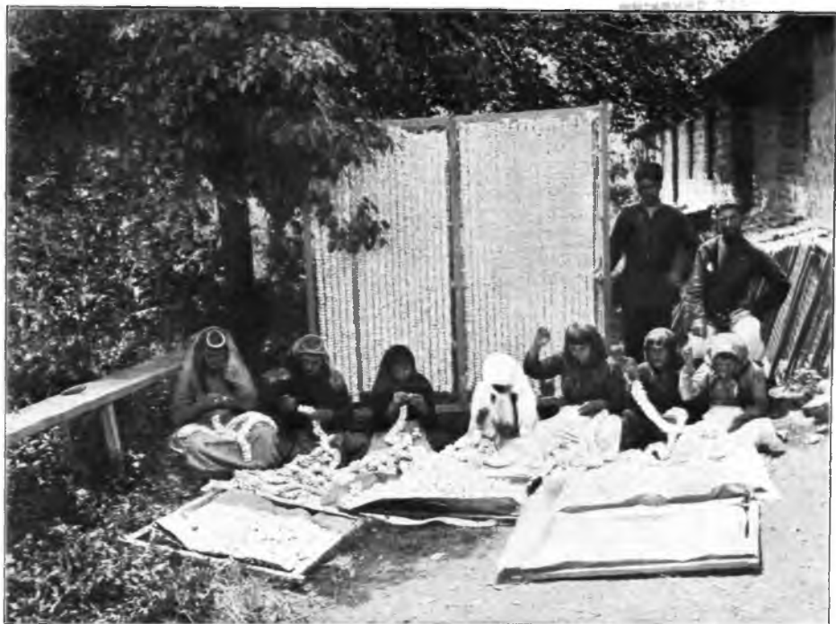
Рис. 117. Гренажъ у нухинскаго гренера.