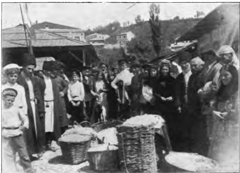
Рис. 113. Коконный рынокъ въ г. Кутаисѣ. (Къ ст. „Очеркъ шелководства въ Россіи“).