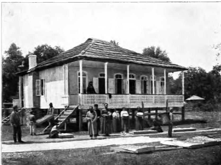
Рис. 120. Покупка и сортировка коконовъ въ гор. Кутаисѣ.