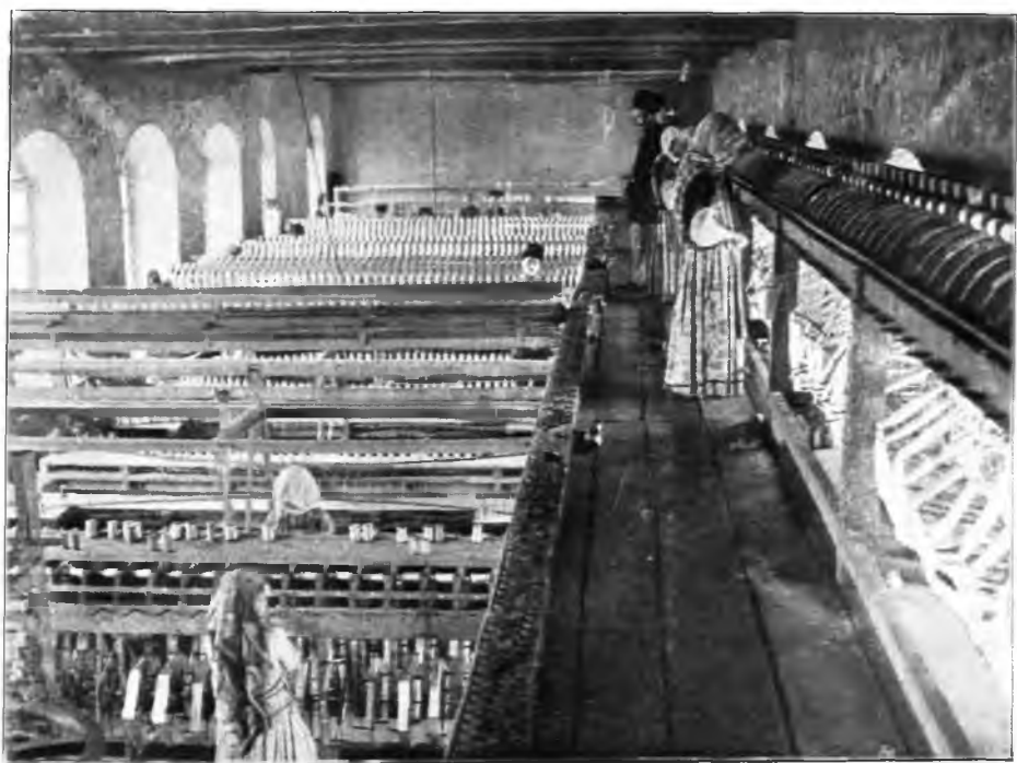
Рис. 122. Шелкокрутильный заводъ въ г. Нухъ.