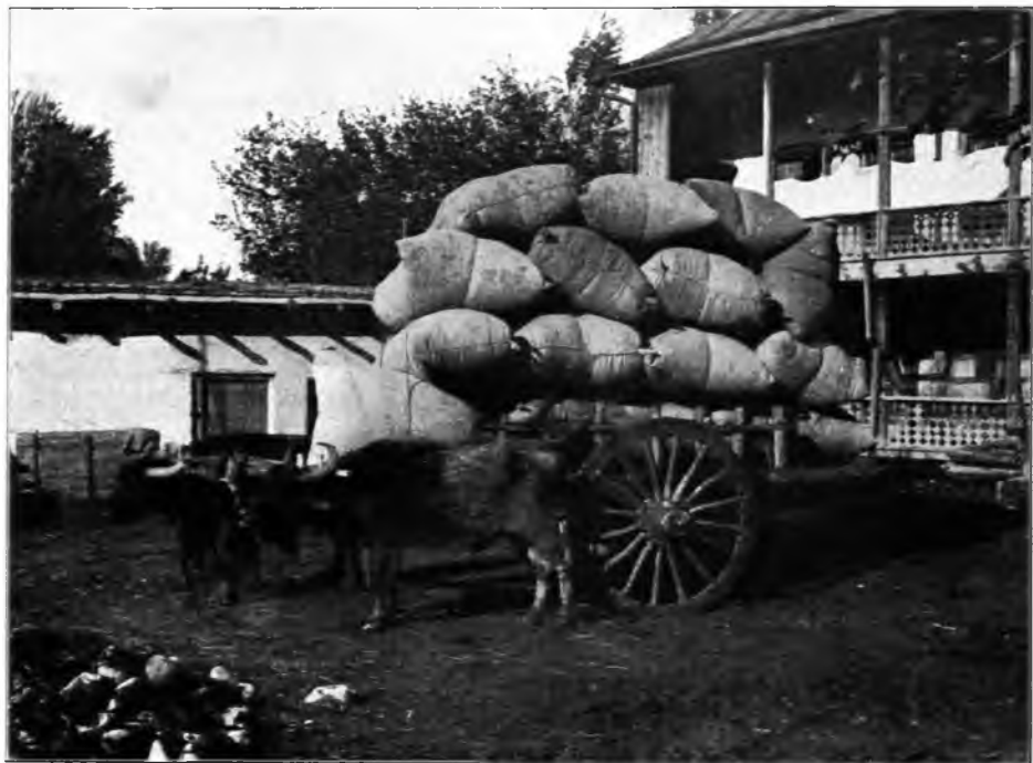
Рис. 119. Перевозка коконовъ въ восточномъ Закавказьѣ.