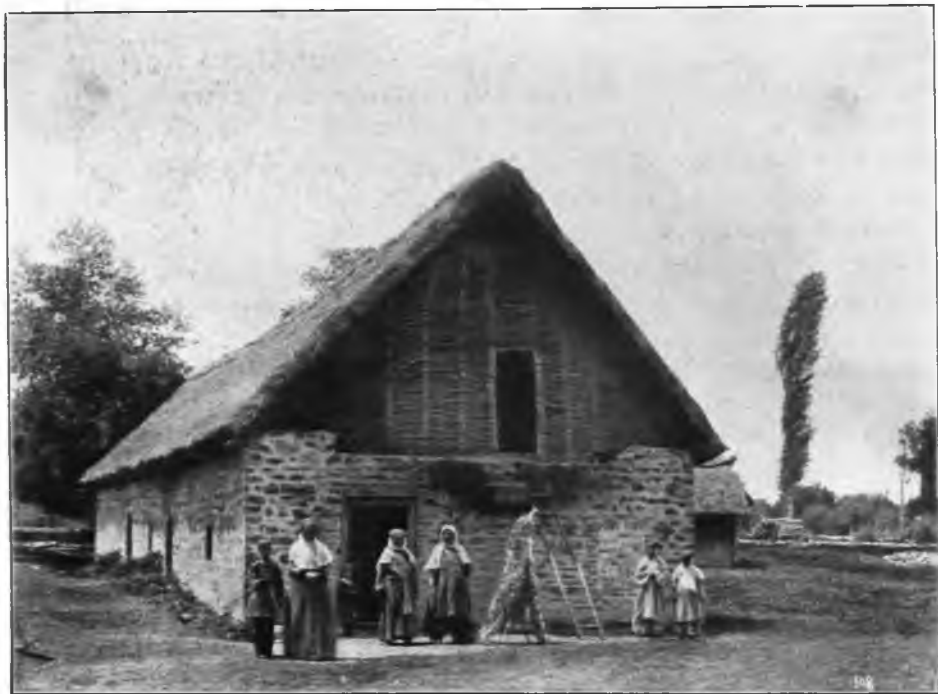
Рис. 115. Червоводня в окрестностях гор. Закаталы.