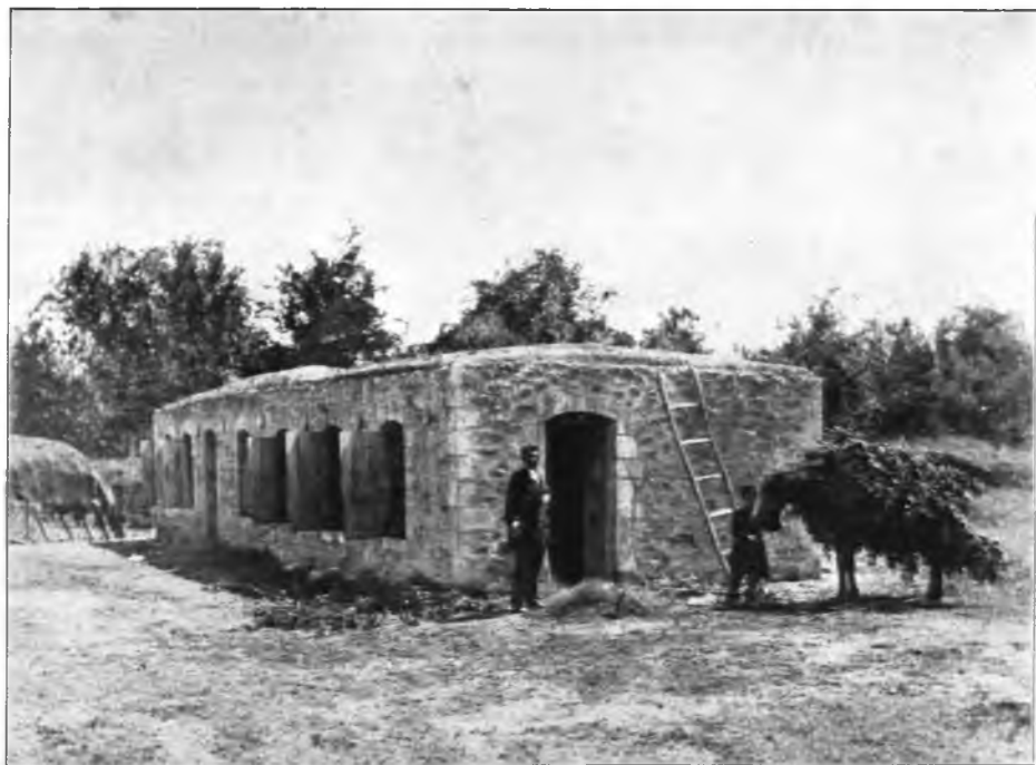
Рис. 114. Черводня въ окрестностяхъ гор. Шуши.