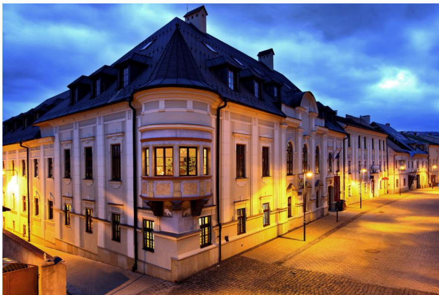
Фото 1. ГНБ в Банской Быстрице

Государственная научная библиотека в Банской Быстрице находится в самом сердце Словакии и вносит свой вклад в улучшение качества жизни не только города, но и всего региона Банска Быстрица (фото 1). Это отличная возможность для библиотеки в городе, где живёт более 75 000 жителей. Преобразование библиотеки в зеленое учреждение посредством постепенной и неустанной работы направлено на изменение ценностей в обществе.