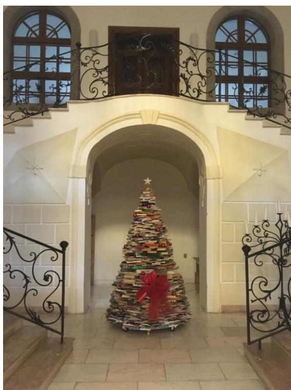
Фото 10. Елка из ненужных книг

Личным творчеством дадим новую жизнь ненужным, выброшенным книгам. Из книг, которые попали бы в бумажное сырьё, наши коллеги сделали елку и кресло, которое стало местом, где читатели любят фотографироваться (фото 10, 11).