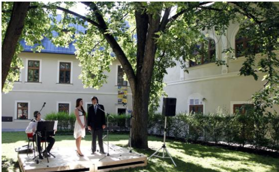
Фото 5. Зеленый двор библиотеки

Уход за зелеными насаждениями около библиотеки (фото 5, 6) а также уход за зеленью непосредственно в библиотеке (фото 7, 8), дает возможность показать нам уникальность библиотеки.