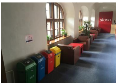
Фото 2. Контейнера для бумаги, пластика, стекла и металла, 2 этаж

В течение нескольких лет библиотека занимается экологическими вопросами. Обеспечение зелёной среды для читателей и пользователей, вопросы экологического поведения библиотеки, экологическое просвещение для достижения одной цели – всё это библиотека предлагает общественности своим поведением. Началом был проект «Введение раздельного сбора коммунальных отходов на уровне субъектов Министерства культуры Словацкой Республики» в рамках оперативной программы «Окружающая среда», в которой библиотека участвовала уже в 2016 году в виде раздельного сбора коммунальных отходов и введения контейнеров для бумаги, пластика, стекла и металла (фото 2, 3, 4). Надлежащая сортировка, то есть разделение отходов, обеспечивает более