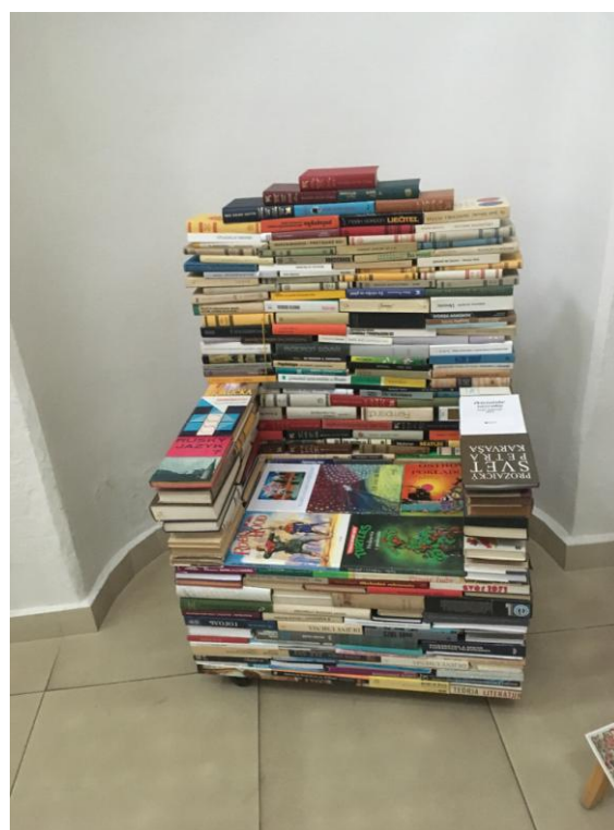
Фото 11. Кресло из ненужных книг

Научиться вести себя экологически – это длинный путь. Предлагаем читателям приходить в библиотеку на уроки по экологическим темам. Это также поможет нам повысить осведомленность об экологическом поведении. Таким путём библиотека может вдохновлять своих сотрудников, читателей и посетителей на зеленое поведение по отношению к окружающей среде.