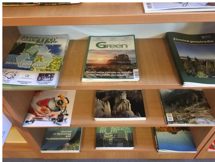
Фото 9. Выбор из научных журналов об экологии

Данная инициатива началась в библиотеке, которую все уважают, и мы надеемся, что оттуда она будет перенесена на прилегающую территорию и станет известной в близком и в более отдаленном окружении библиотеки. Мы предлагаем нашим читателям и посетителям весной, летом и осенью зеленую среду для учебы и отдыха во дворе библиотеки. Мы создали зеленую библиотечную среду как для сотрудников, так и для пользователей. Мы узнаем, как ответственно и должным образом сортировать отходы. Мы предоставляем в наших читальных залах информацию о том, как вести себя экологически (фото 9).