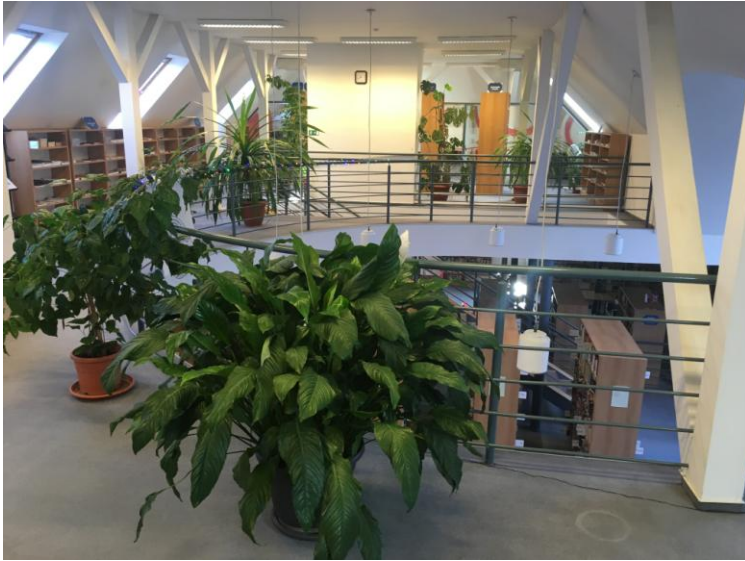
Фото 7. Универсальный читальный зал