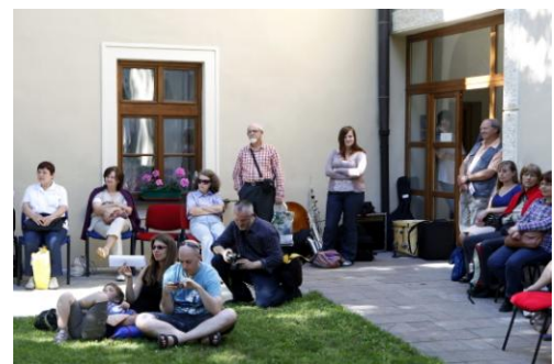
Фото 6. Зона отдыха и развлечения

интерьере библиотеки можно создать приятную и, прежде всего, более здоровую рабочую среду для сотрудников в современных холодных офисных помещениях. Зелень поощряет творчество и, таким образом, повышает производительность труда. Зелень на рабочих местах снижает агрессию и стресс и повышает концентрацию сотрудников и читателей. Устранение негативных факторов повысит приверженность к работе и к учёбе. Кроме того, современные цветочные горшки упрощают уход за растениями до минимума, поэтому опасения по поводу требовательного ухода неуместны. В помещении библиотек, где находится зелень, повышается влажность воздуха, уменьшается пыль и шум, устраняется статическое напряжение. Библиотечные работники и читатели чувствуют себя комфортнее. Таким образом, с помощью зелени мы можем создать более гармоничную и, что не менее важно, более здоровую среду в нашей библиотеке. Современные возможности выращивания растений гидропонным способом, т.е. без почвы в питательном растворе решают проблемы размещения растений в зонах с повышенными требованиями к гигиене. Этим критериям соответствуют гидропонные установки, поэтому их можно размещать и в помещениях библиотеки.