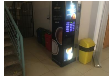
Фото 4. Контейнера на 1-ом этаже

чистую окружающую среду, экономит природные ресурсы сырья и энергии, уменьшает количество отходов на свалках и, таким образом, позволяет их перерабатывать и повторно использовать. Мы все участвуем в сортировке мусора, поступающего из наших библиотек на свалки и, соответственно, до мусоросжигательных заводов. Однако именно на свалках среди бытовых отходов есть еще и такие, которые после определенных модификаций могли бы использоваться как источник вторичного сырья. Таким образом, отдельный сбор в библиотеках гарантирует, что отдельные виды могут быть повторно использованы после сортировки. Такой подход поможет нашей Земле,