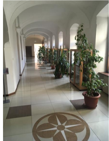
Фото 8. Коридор библиотеки на 2 этаже

Первоначальная роль библиотек меняется в настоящее время. Мы считаем, что библиотеки могут быть отправной точкой для перемен. Целью проекта Государственной научной библиотеки является укрепление культурного сознания, распространение культуры экологического поведения. Библиотека вносит большой вклад в этот проект. Основным критерием для реализации проекта является тоже сохранение зеленой среды как в интерьере, так и экстерьере, так что библиотека продолжает предлагать всем посетителям пространство для учебы, отдыха и развлечения в приятной обстановке и может научить сотрудников и пользователей библиотеки вести себя экологически и обеспечивать устойчивость проекта.