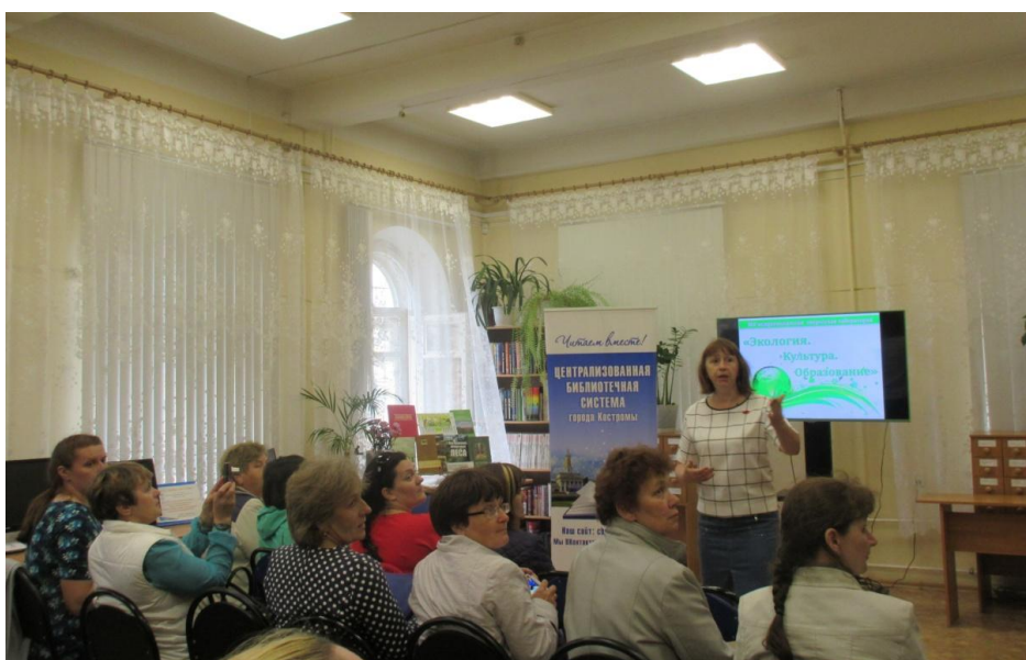
Гости из Вологды. Творческая лаборатория

Вологжане с большим интересом познакомились с инновационным электронным ресурсом «Мир заповедный. Экологическая карта Костромской области».