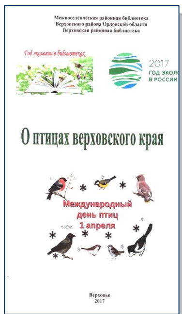
Рис. 3. Информационное пособие «Малые реки – истоки больших»