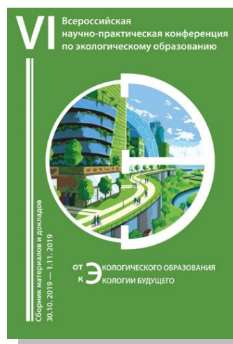
Рис. 8. От экологического образования к экологии будущего. Сборник материалов