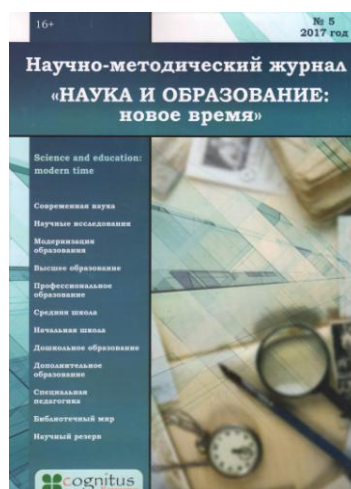
Рис. 6. Наука и образование. Научно-методический журнал

nauchno-metodicheskogo-zhurnala-nauka-i-obrazovanie-novoe-vremya-5-2017-16/ в рубрике «Библиотечный мир».