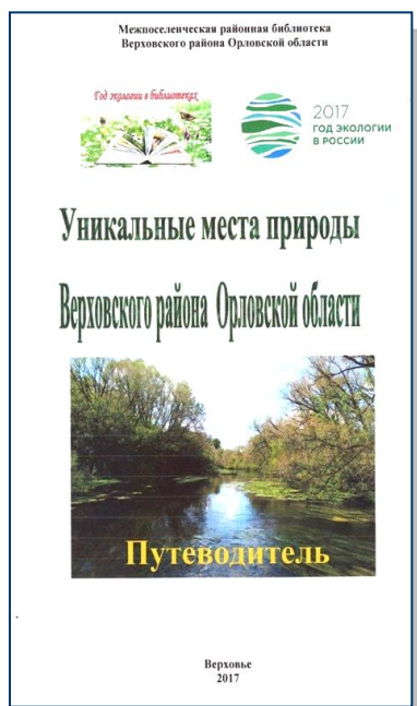
Рис. 2. Путеводитель «Уникальные места природы Верховского района»

Библиограф составила информационно-библиографические пособия малых форм краеведческого направления: «Святые источники Верховского района», путеводители «Уникальные места природы Верховского района Орловской области» и «Лесное богатство Верховского края», путеводитель по парку культуры и отдыха поселка Верховье им. Ю.А. Гагарина «Пройдусь по парку...», путеводитель «Святой источник и часовня в честь Николая Чудотворца в деревне Семеновка (Красинка) Галичинского сельского поселения Верховского района». В рамках экологического календаря районная библиотека составила серию информационно-библиографических пособий: ко Всемирному дню воды «Малые реки – истоки больших», «О птицах верховского края» (День птиц), к Дню экологических знаний «Всё прекрасное на Земле от солнца, всё хорошее от людей», к Всемирному дню окружающей среды «Я с природой», ко Дню Земли «Колокол Мира в честь Дня Земли»