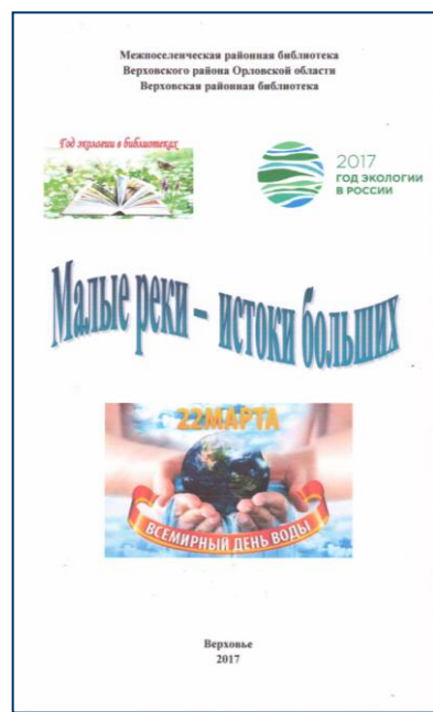
Рис. 4. Библиографическое пособие «О птицах Верховского края»