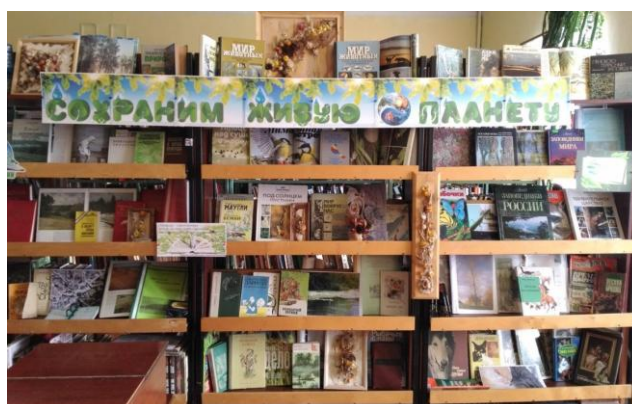
Рис. 1. Выставка. Сохраним живую планету

Через мероприятия сотрудники библиотеки стараются сформировать экологическое мышление у детей среднего и старшего школьного возраста, прививают им любовь к природе; развивают