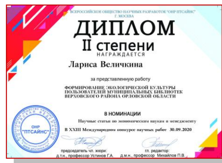
Рис. 9. Диплом конкурса научных работ