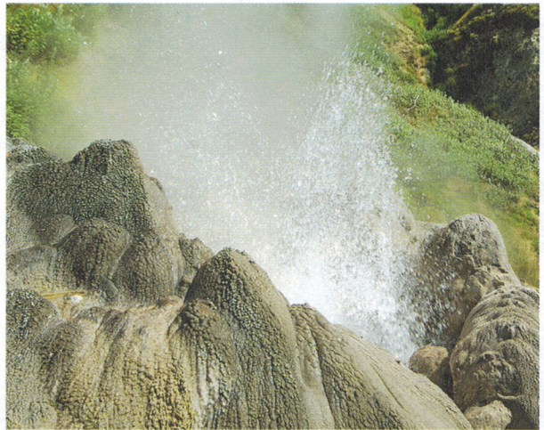
105. Сахарный. Фото И. П. Шпиленка, 2005.