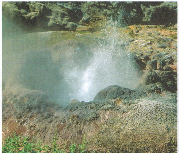
106. Извержение Сахарного, вид сверху. Фото А. Б. Белоусова, 2001.