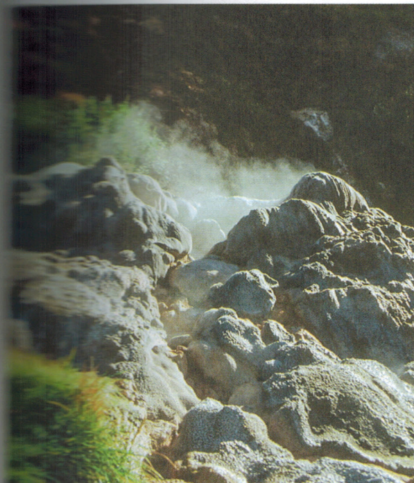
103. Грифон Сахарного, вид снизу. Фото А. Б. Белоусова, 1998.

... оценивали высоту извержения в 2-3 м 207 .