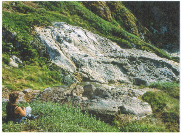
104. Грифон Сахарного, вид сверху. Ожидание извержения. На заднем плане – гейзеритовый щит Тройного, справа видна река Гейзерная. Фото А. Б. Белоусова, 2006.