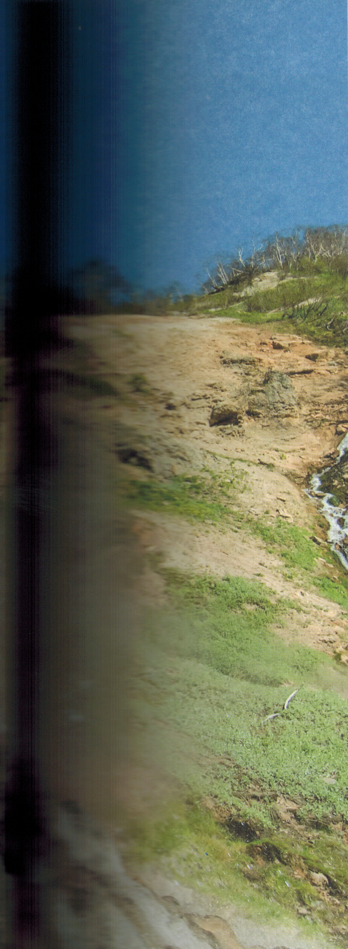
107. Извержение Сахарного, вид снизу.