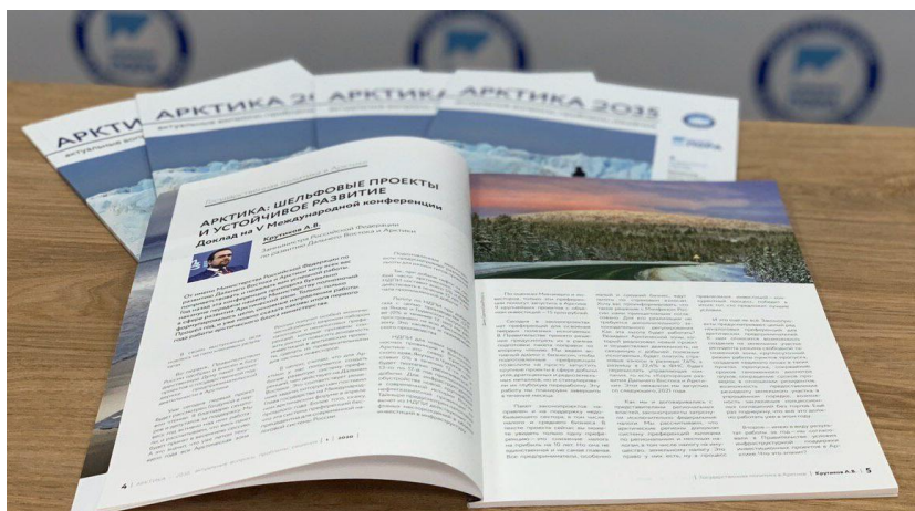
Журнал «Арктика 2035: актуальные вопросы, проблемы, решения»

Масштабным проектом является Экспертный совет. Совет представляет собой объединение внештатных экспертов, принимающих участие в заседаниях Дискуссионного клуба, грантополучателей и участников других проектов ПОРА, видных ученых, государственных и общественных деятелей. Здесь формируется открытое пространство идей, инициатив, проектных предложений, представляются компетентные мнения. В ПОРА посчитали необходимым использовать этот экспертный потенциал и продемонстрировать его общественности. Так был создан журнал «Арктика 2035: актуальные вопросы, проблемы, решения», в котором публикуются статьи членов Экспертного совета. Материалы журнала отличаются свежим, новаторским взглядом на существующие проблемы Арктики: проблемы воздействия активной хозяйственной деятельности на природу, на жизнь коренных народов, устойчивого развития, использования ресурсов. «Арктика 2035: актуальные вопросы, проблемы, решения».