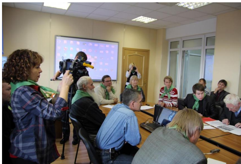
Рис. 1 Круглый стол по ферросплавному заводу

Когда решалась возможность строительства завода ферросплавов в черте города, а следовательно и судьба горожан, в городе прошли протестные акции. Но впервые вопрос о невозможности функционирования подобного производства рядом с миллионным городом обсудили юристы, входящие во Всероссийскую экологическую организацию «Зеленая лига» в Центре экологической культуры в присутствии чиновников и депутатов (рис. 1). Эта тема стала для Центра еще длительное время ведущей, пока вопрос о строительстве завода не был закрыт. Эти обсуждения демонстрируют возможность тесного взаимодействия библиотеки с властными структурами в принятии взвешенных экологических решений.