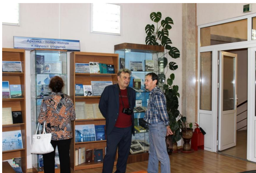
Рис. 3 У выставки по Арктике

В 2019 году в Центре экологической культуры был реализован очень интересный проект: «Арктика. Экология человеческих ресурсов». Инициатором проекта выступила наша библиотека совместно с некоммерческим партнерством «Центр творческих инициатив «Три сферы». На протяжении года состоялось несколько интересных мероприятий, посвященных этой теме. Среди них презентация книжно-иллюстративной экспозиции «Арктика – полюс холода и мужества», (рис. 3) фотовыставка «Арктика: известная и неизвестная». Жители города смогли встретиться с заслуженным спасателем Российской Федерации Валерием Кохановым, обладателем титула «Снежный барс» за восхождения на все семитысячники Советского Союза., непосредственным участником экспедиции через северный полюс.