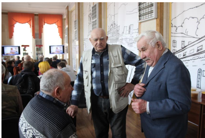
Рис. 5 Юбилей клуба пчеловодов

При Центре уже не менее 20 лет клубы, ориентированные исключительно на ветеранов труда, которые имеют свои садовые участки. Это клуб «Садоводов-опытников», клуб «Овощевод», клуб «Цветоводов», «Школа ландшафтного дизайна», Информацию, которую получают участники клубов, наполнена экологическим содержанием. Главная мысль всех занятий – урожай на 6 сотках в согласии с Природой. Значительно шире география участников клуба «Пчеловодов-любителей», который работает в библиотеке уже 30 лет. Это по-своему уникальное объединение мужчин по интересам не только города, но и близлежащих районов. Пчеловоды-любители делятся опытом получения самого экологически чистого продукта – мёда. В марте этого года центр организовал для пчеловодов юбилейный вечер, посвященный 30-летию клуба (рис. 5).