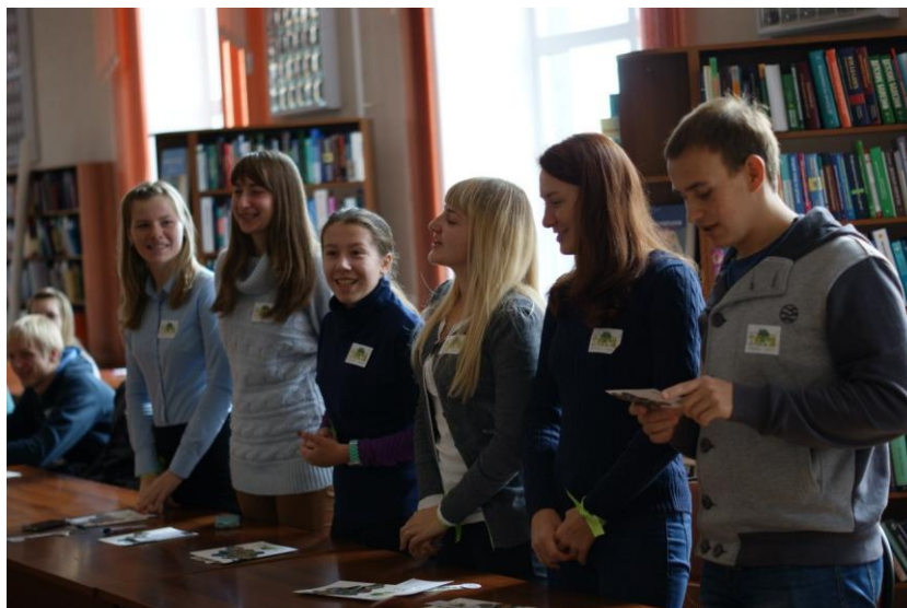
Рис. 2. FSC-пятница

В Международный день леса Центр совместно с офисом FSC организует для общественности города Праздник леса, в котором принимают участие Алтай-Саянское отделение WWF России и Центр защиты леса Красноярского края. Один из Праздников завершился круглым столом, где специалисты и общественность города обсудили вопросы участия общественных экологических организаций в сохранении лесов. Руководитель Центра неоднократно участвовала в брифингах FSC и web-семинарах. 2014 году мы удостоились Почетной Грамоты Российского национального офиса FSC и стали членом FSC-клуба.