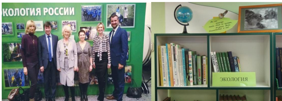
Экологические проекты и акции