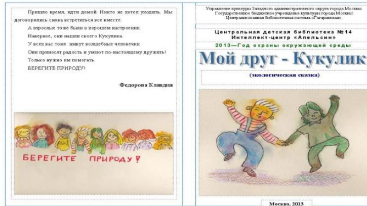
Международный конкурс детских творческих работ «Новые добрые сказки в номинации «Экологическая сказка»