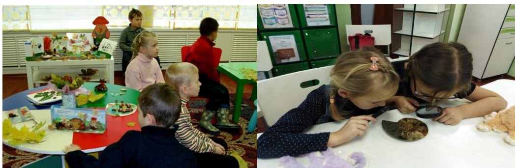
Кружок «Мир вокруг нас»