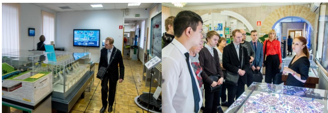
Экскурсии в музее Воды, открытым Мосводоканалом