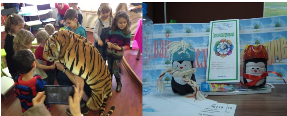
Литературные викторины, детские творческие конкурсы поделок из природного материала и экологические игры