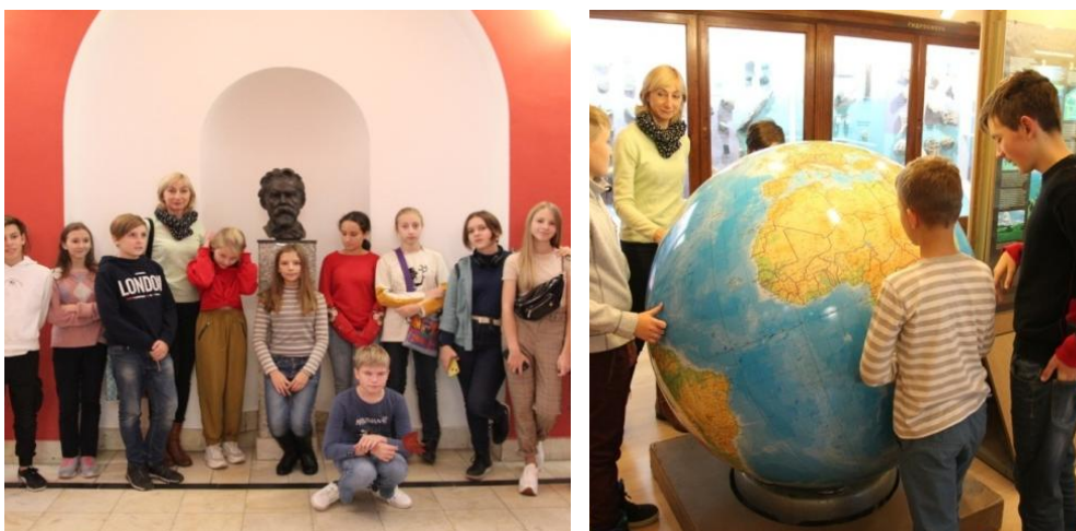
Экскурсия в геологический музей Москвы им. академика В. И. Вернадского