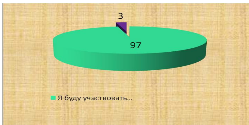
Рис. 3. Результаты опроса населения ст. Старица «Буду ли я и в дальнейшем принимать участие в проекте «Добрые крышечки. Разделяй и здравствуй!»