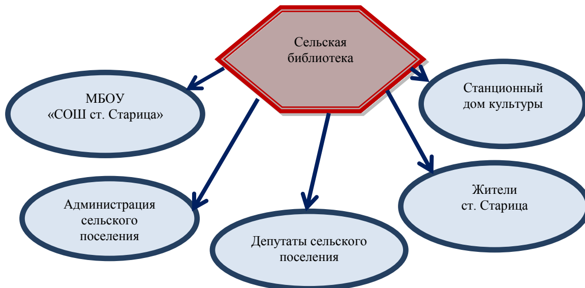
Рис. 2. Партнёры Станционной сельской библиотеки в осуществлении проекта «Добрые крышечки. Разделяй и здравствуй!»