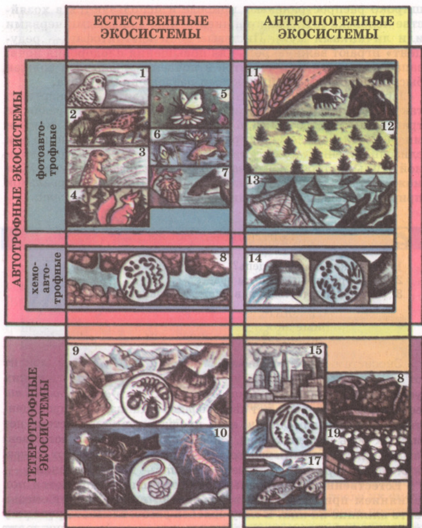
Рис. 5. Основные типы экосистем

Цифрами обозначены: 1 – тундры, 2 – болота, 3 – степи, 4 – леса, 5 – луга, 6 – пресноводные водоемы, 7 – моря, 8 – экосистемы океанических глубин, 9 – экосистемы высокогорных ледников, 10 – экосистемы океанических глубин, 11 – сельскохозяйственные экосистемы, 12 – лесные культуры, 13 – морские «огороды», 14 – экосистемы биологических очистных сооружений, 15 – города и промышленные предприятия, 16 – экосистемы биологических очистных сооружений, 17 – рыбозаводные пруды, 18 – культура дождевого червя, 19 – плантации шампиньонов