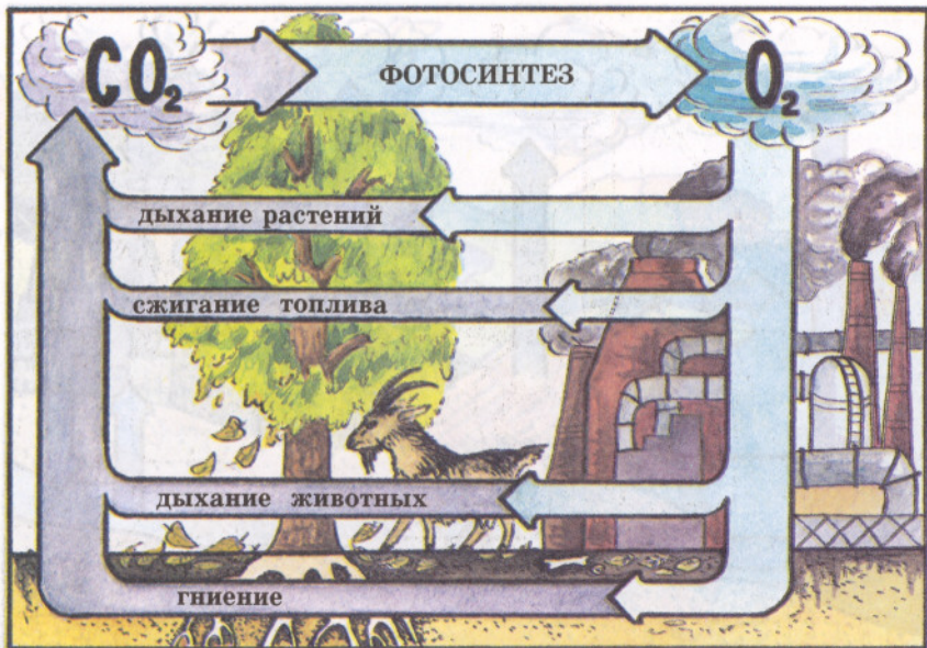
Рис. 14. Цикл кислорода и диоксида углерода в биосфере